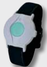
Arbandsender mit Begleitfunktion S37E