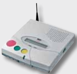
NurseCall Main Unit